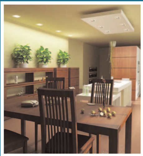
Lightolier – Lytecaster Xceed

Les luminaires homologués ENERGY STAR utilisent 75 % moins d'énergie que l'éclairage traditionnel et ont une durée de vie jusqu'à 10 fois plus longue. En remplaçant les cinq luminaires les plus utilisés de votre foyer par des modèles homologués ENERGY STAR, vous pourriez économiser 70 $ chaque année en coûts d'énergie.