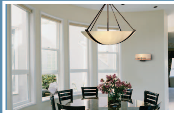
American Fluorescent – Carson

Les luminaires homologués ENERGY STAR procurent un éclairage magnifique de haute qualité. Ces luminaires ont été conçus spécialement pour intégrer des sources lumineuses efficaces et réfléchir la lumière de façon plus efficace et uniforme que les luminaires traditionnels. Les luminaires gagnants de «L'éclairage de demain» font partie de collections de luminaires intérieurs et extérieurs disponibles dans une variété de finis et de styles qui s'harmonisent à tous les décors.