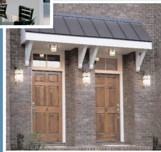
Sea Gull Lighting – Eternity

Les sources lumineuses efficaces des luminaires homologués ENERGY STAR sont conçues pour durer au moins 10 000 heures (environ sept années d'utilisation régulière) et comportent une garantie de deux ans, le double de ce qui est normalement offert dans l'industrie.